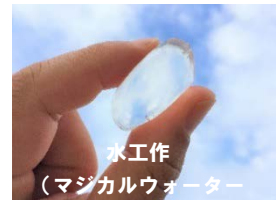
水工作 （マジカルウォーター）